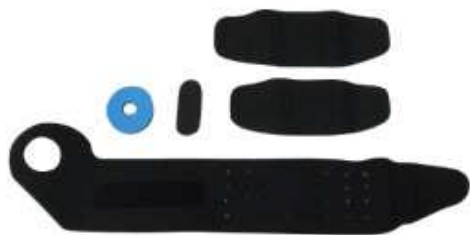
※同封されているパーツ（左用の場合）